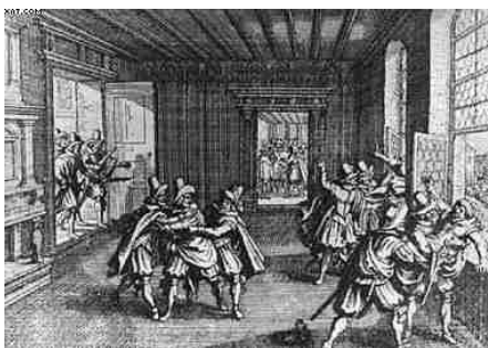
Rådsmandene på vej ud af vinduet

katolske rådsmand resolut blev kastet ud af vinduet på slottet i Prag. De havnede fortæller historien, rimeligt uskadt i en møgbunke, men alligevel førte dette lille intermezzo til Trediveårskrigen. Tjekkerne afsatte Ferdinand, men han vendte tilbage støttet af Den Katolske Liga i Tyskland, og i 1620 kom det til slaget ved Det Hvide Bjerg (Bila Hora) uden for Prag. Her led protestanterne, og dermed reelt tjekkerne, et