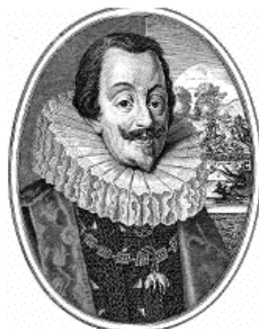
FERDINAND II PAR LA GRACE DE DIEU EMPEREUR DES ROMAINS.

Man skal frem til midten af 1700-tallet før der under kejserinde Maria Theresia og især hendes søn Josef 2. sker en markant økonomisk