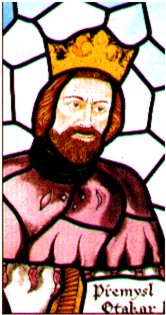
Otakar II Premysl

Med Det Stormæhriske Rige i 800-tallet skimtes de første konturer af en egentlig statsdannelse. Riget havde centrum i det sydlige Mæhren. Det Stormæhriske Rige fik dog kun en kort levetid fra 830 til 908, hvor ungarene invaderede den østlige del af riget, det nuværende Slovakiet, medens det lykkedes den vestlige del at holde stand. Efter Det Stormæhriske Riges fald, skulle der gå mere end 1000 år, før de to dele igen blev samlet til en nationalstat.